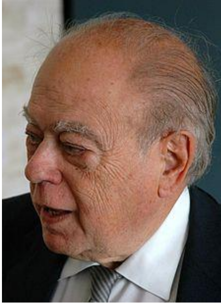
Jordi Pujol en 2008.